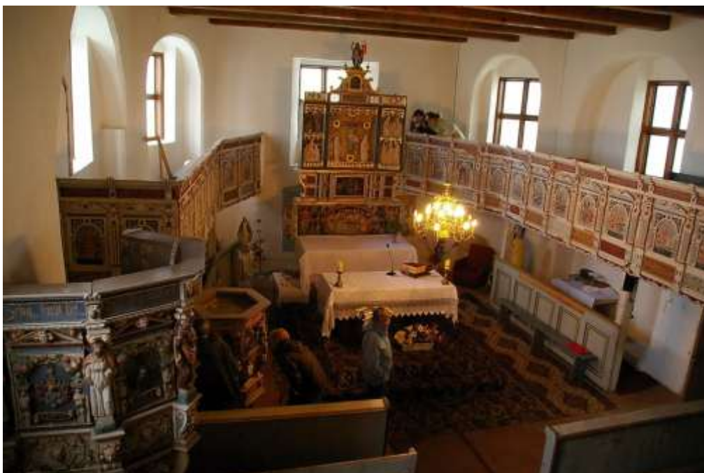
Wnętrze kościoła p.w. Św. Trójcy w Wysiedlu

Zwiedzanie z przewodnikiem po wcześniejszym zgłoszeniu