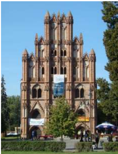
Ratusz w Chojnie

Konkurs skierowany do uczniów szkół podstawowych – zabytki malowane na kamieniach