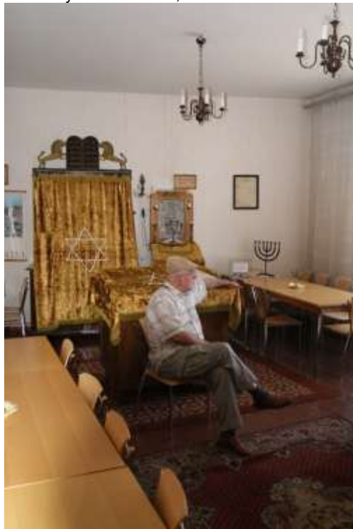
Wnętrze domu modlitwy gminy żydowskiej w Szczecinie.

Koordynator: Róża Król Kontakt: tel. 91-422-06-74 Organizator: Towarzystwo Społeczno-Kulturalne Żydów w Polsce, Oddział w Szczecinie