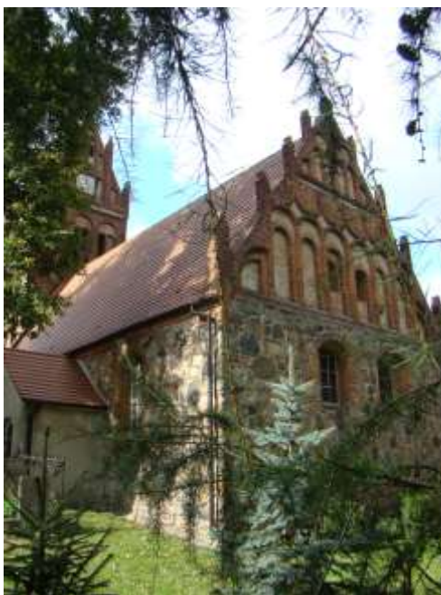
Kościół p.w. Wniebowzięcia NMP w Pęczynie

Zapisy: 29.08.-2.09. e-mailowo k.szypowski@powiatstargardzki.eu