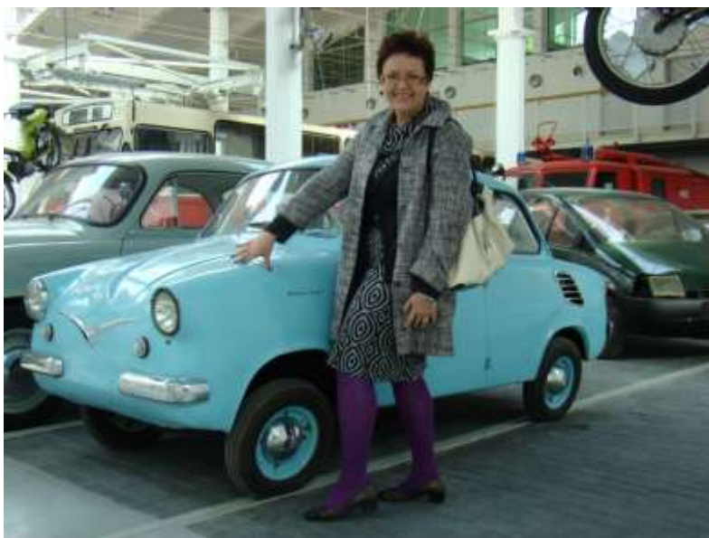
Na wystawie Muzeum Komunikacji i Techniki Zajezdnia Sztuki

Grupa do 30 osób – zapisy od 29.08. w godz. 9.00-11.00 pod numerem tel. 508-193-730