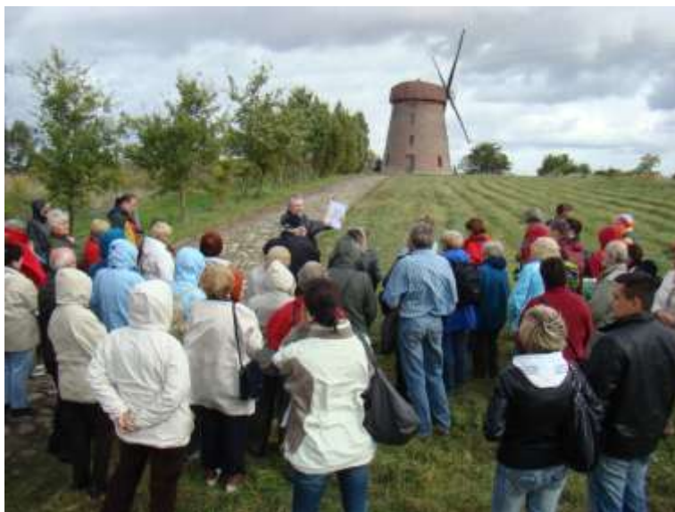
Uczestnicy EDD 2010 przed wiatrakiem w Poradzu