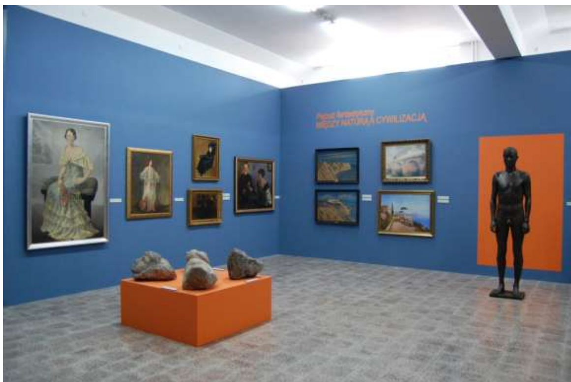
Fragment wystawy „Sztuki Piękne. Zbiory artystyczne Muzeum Narodowego w Szczecinie”.

Dla uczestników egzemplarze publikacji towarzyszącej EDD z artykułem „Między przeżyciem muzyki a portretem scenicznym – Tancerka Antonia Mercé zw. La Argentina Maksa Slevogta w zbiorach Muzeum Narodowego w Szczecinie” – o jednym z dzieł prezentowanych na wystawie.