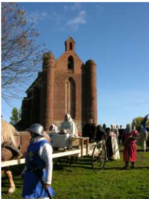
Kościół pw. Św. Stanisława Kostki w Chwarszczanach (kaplica zakonna). Inszenżacja odtwarzającej upadek zakonu templariuszy w 2007 r.