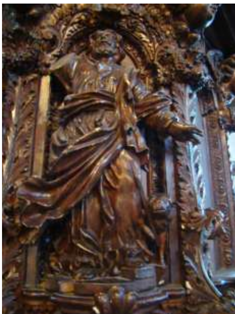
Fragment ambony w kościele p.w. Św. Ducha w Moryniu